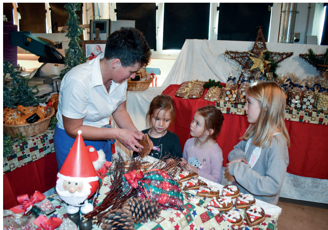
Nicht nur für Kinderaugen war das Angebot der Bäckerei Schefer verlockend.

Neben den neuen Angeboten waren verschiedene bewährte Standbetreuerinnen und -betreuer mit ihren kreativen Produktsortimenten zugegen.